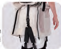
位於裙襠下面的皮帶，運動向上捲起皮帶達到輔助人體的效果。

感測器能檢測出身體的動作，由馬達驅使皮帶向上捲合進而幫助人體的動作及姿勢。即使是連續且複合的動作也可以對應，能確實感受到裝置提供的輔助力道。也可以根據自己使用的狀況來選擇最適合的模式。